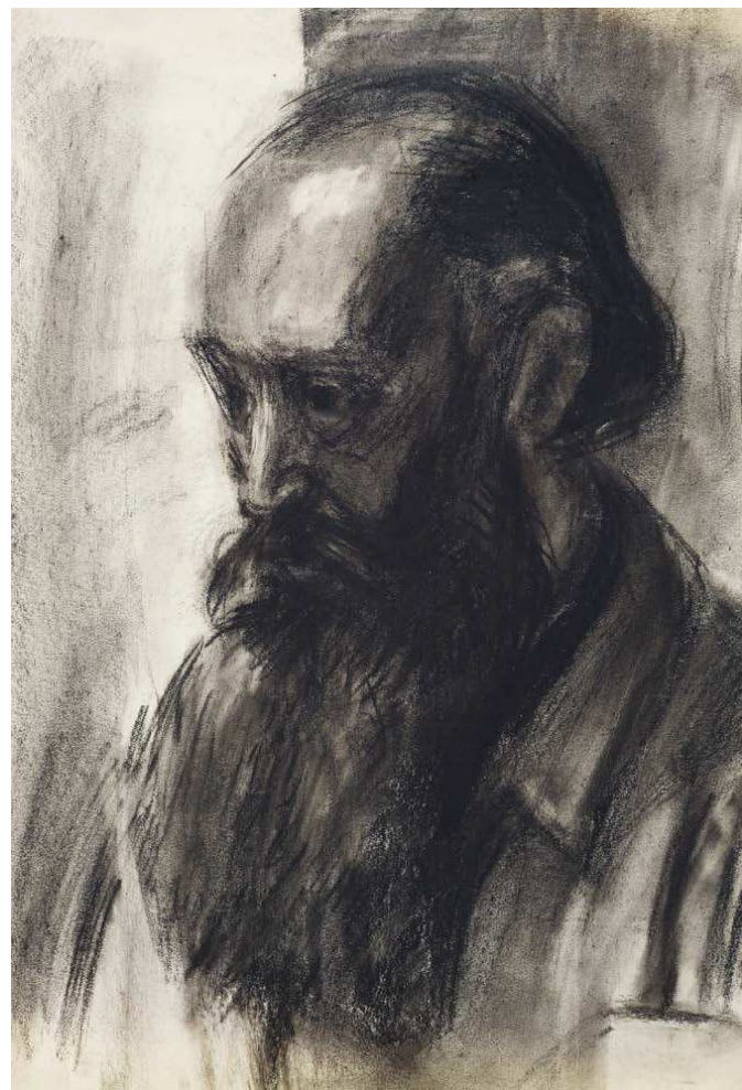
105. Fejtanulmány XX. | Study of a Head XX. 330 x 245 mm, ceruza, papír; pencil on paper