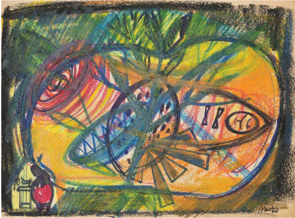
102. Alma | Apple 237 x 320 mm, vegyes technika, papír; mixed media on paper