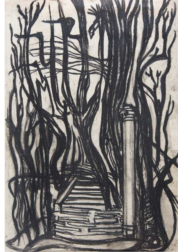
101. Lépcső II. | Stairs II. 530 x 370 mm, pittkréta, papír; conté crayon on paper