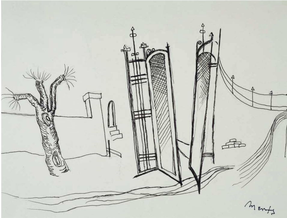
100. Nyitott kapu | Open Gate 190 x 250 mm, tus, papír; India ink on paper