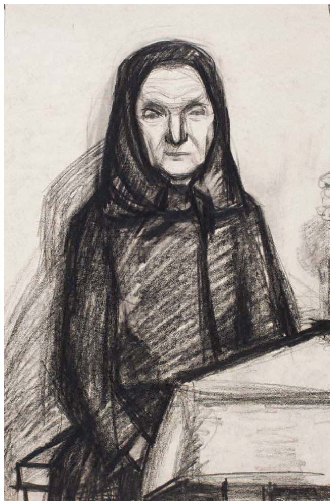
104. Öregasszony | Old Woman 310 x 200 mm, ceruza, papír; pencil on paper